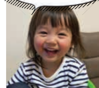
@ ruuruu.121626 さん