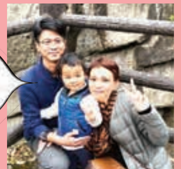
@ nanamint94_swc さん