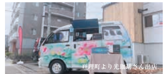
亘理町より光珈琲さん出店