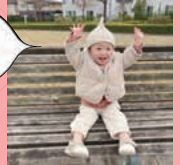
@ acoao2013 さん