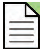
フリーペーパーの 内容をシンプルに

新型コロナウイルス感染拡大防止等を受け、人が多く集まる講座、イベントを縮小し、オンライン開催との併用を行います。 フリーペーパーの規模も縮小し、WEBサイトでの情報発信も行います。 子育て中のママたちに安心、安全な方法で情報をお届けすること、 そして一刻も早く事態が終息に向かうよう、今後も積極的に取り組んで参ります。