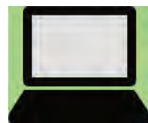
講座・イベントは オンラインの場合も